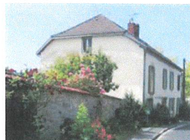
Table d'hôtes avec savoureuse cuisine traditionnelle sur réservation !

Entre 2 expéditions, vous pourrez vous reposer dans la maison ou dans le jardin en dégustant du champagne pendant que vos enfants joueront dans la petite maison ou à la balançoire.